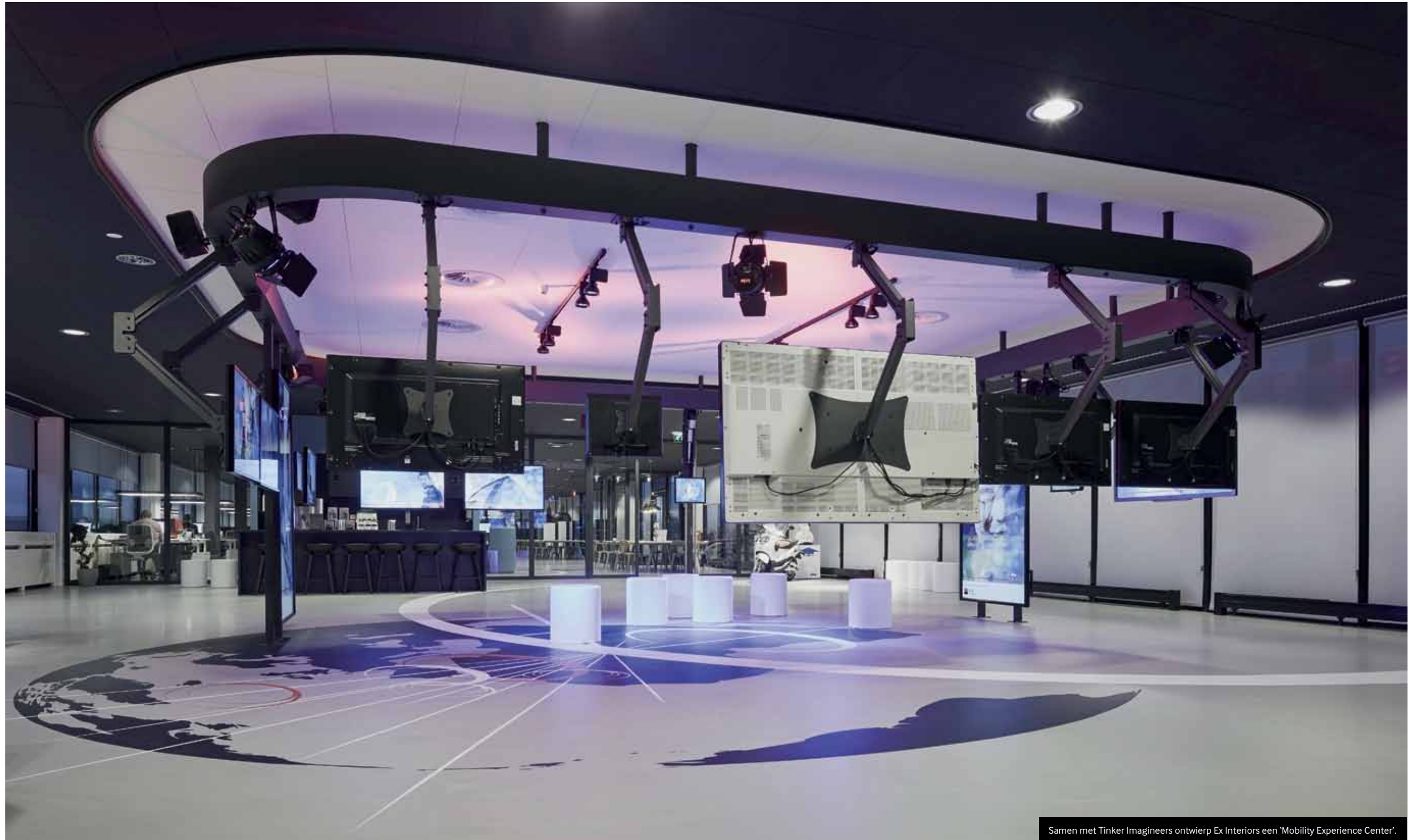
Samen met Tinker Imagineers ontwierp Ex Interiors een 'Mobility Experience Center'.

OE Bedrijven hebben grote ambities, willen vernieuwen, maar kampen tegelijk met beperkte budgetten. Het is een uitdaging om binnen de kaders letterlijk en figuurlijk ruimte te scheppen voor de ambities van een bedrijf. Het leert ons jongleren en zet onze creativiteit op scherp. Als ik bij ALD rondloop, zie ik blije mensen die het Nieuwe Werken hebben omarmd. Hun droom is gerealiseerd en daarmee ook de onze.