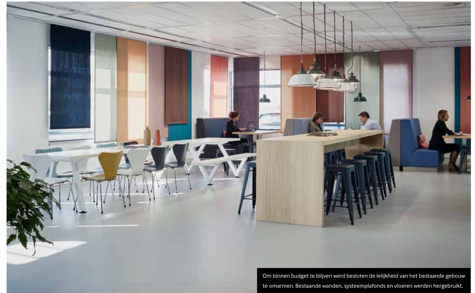
Om binnen budget te blijven werd besloten de lelijkheid van het bestaande gebouw te omarmen. Bestaande wanden, systeemplafonds en vloeren werden hergebruikt.

OE We hebben de standaard doorbroken door