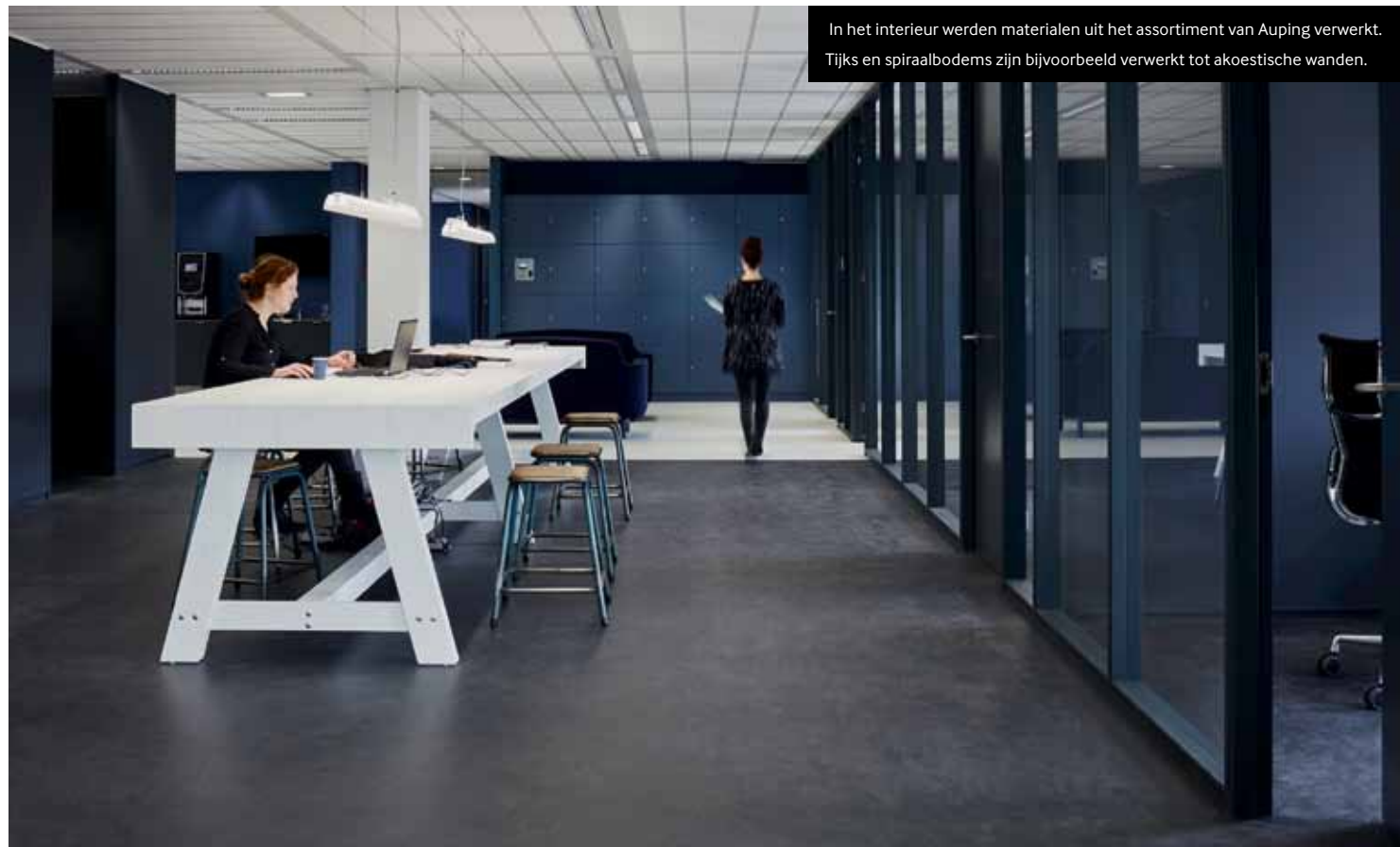
In het interieur werden materialen uit het assortiment van Auping verwerkt. Tijks en spiraalbodems zijn bijvoorbeeld verwerkt tot akoestische wanden.