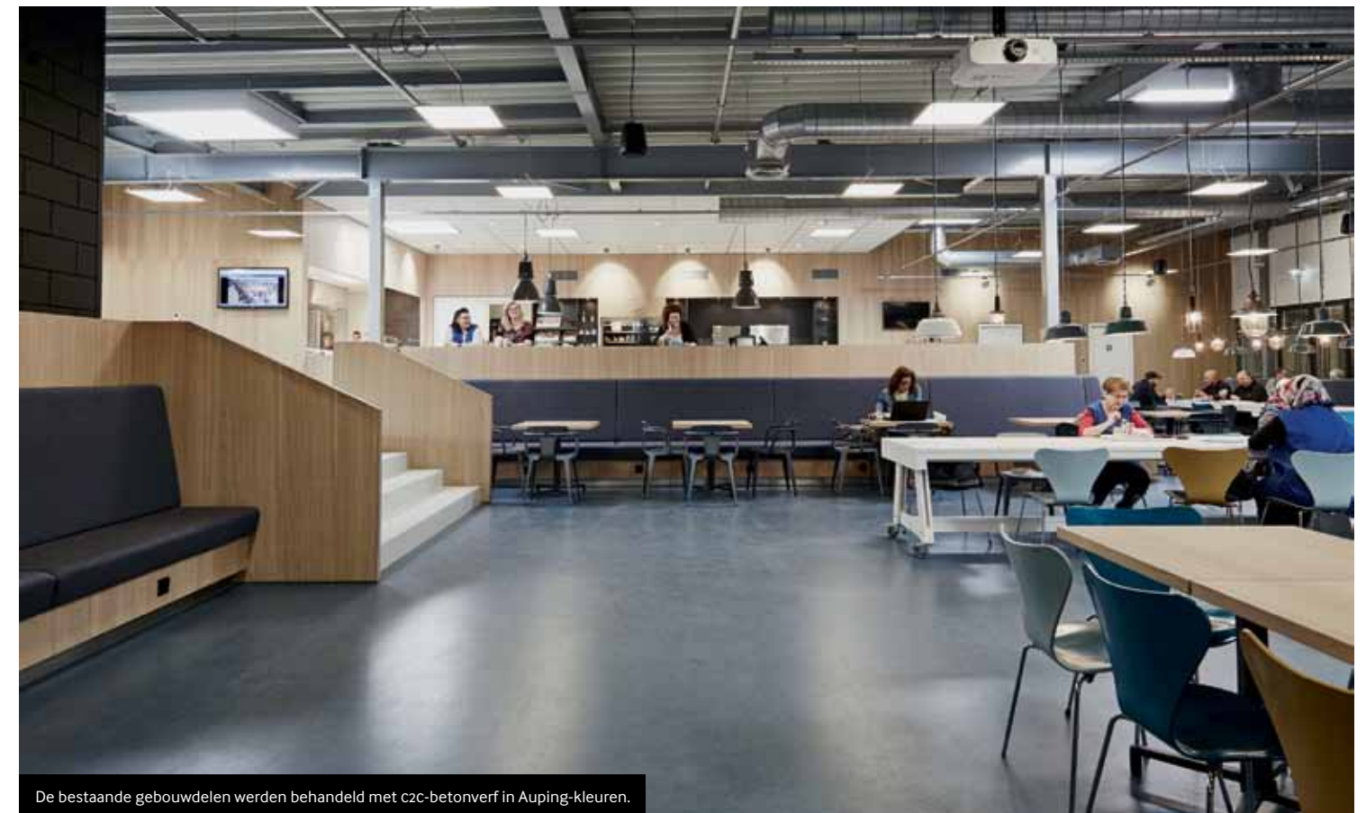
De bestaande gebouwdelen werden behandeld met c2c-betonverf in Auping-kleuren.