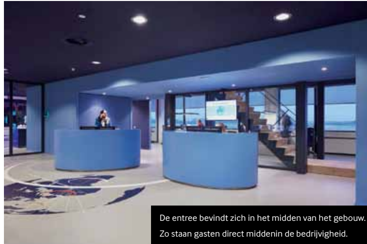
De entree bevindt zich in het midden van het gebouw. Zo staan gasten direct middenin de bedrijvigheid.

Speciaal voor ALD Automotive ontwikkelde Ex Interiors in samenwerking met Desso een tapijt waarin de kleuren rood, paars en blauw van de wanden in verschillende gradaties terugkomen. Het tapijt accentueert de individuele werkplekken in het kantoor en legt een visuele relatie met de gesloten overlegplekken. Ex Interiors ontwikkelde al vaker in samenwerking met fabrikant Desso tapijten. Het heeft geleid tot de samenstelling van een speciale EX-Desso Collection voor de hotel- en kantoorbranche. Dit jaar wordt de collectie op de markt gebracht.